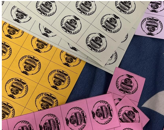
Sticker bình chọn của các khối lớp

Sau các tiết mục vui chơi giải trí từ văn nghệ đến trò chơi, CLB đã tạo điều kiện cho các bạn học sinh tham quan và tự chiêm diễm các tác phẩm báo giấy của mình, của các bạn các anh chị ở tại sân trường. Hầu như các bạn ai cũng đam mê cũng rất nhiệt tình tham gia, những lời bình, những tranh ảnh và các hoạt động giao lưu học hỏi diễn ra rất sôi động và hào hứng. Ai cũng muốn chia sẻ những kiến thức, những hiểu biết về các phong tục tập quán mà mình đã tìm tòi có được.