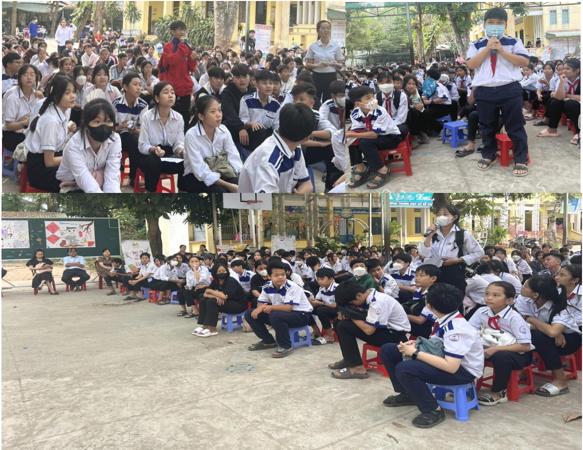
Phần giao lưu - trả lời câu hỏi “Catch The Word” của một số bạn học sinh