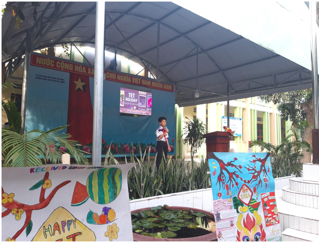
Tiết mục đơn ca “ Fly Away - TheFatRat, Anjolie” của bạn Nghĩa lớp 7A1